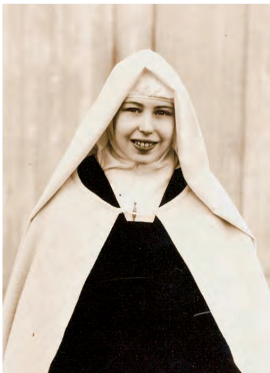
► Imagen de la Madre M a Isabel cuando todavía era novicia.

Ahora llega la fase conclusiva de la Causa en la Diócesis. Es tiempo de dar gracias a Dios y de poner, una vez más, todo este camino en sus manos, para su mayor gloria, a través del Corazón Inmaculado de la Virgen