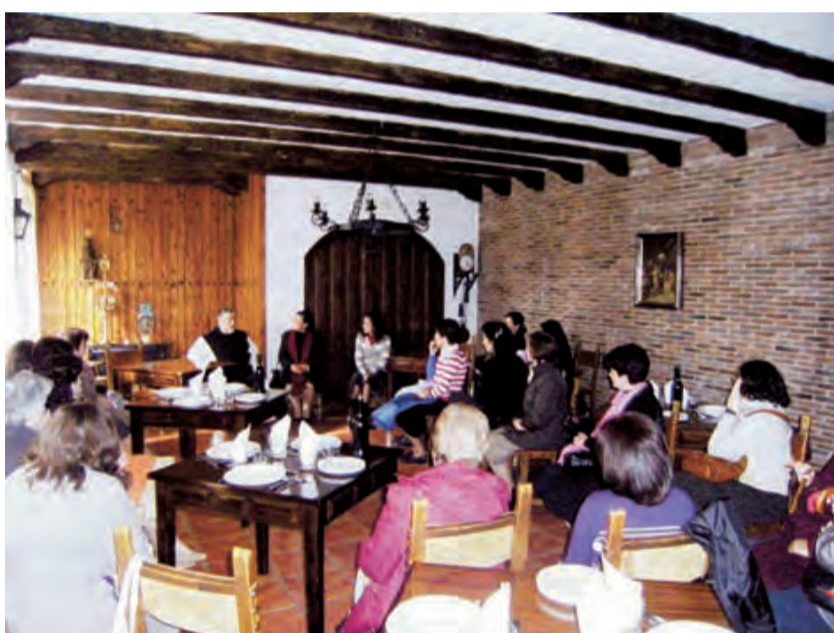
► Uno de los momentos de conversación de la peregrinación.