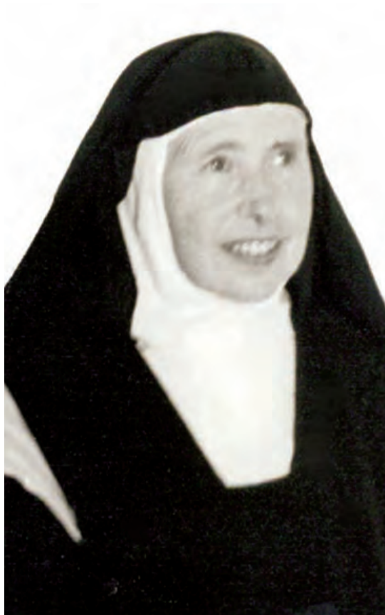
► Sonrisa de la Madre M a Isabel.

En estos cinco años, ha sido el Espíritu Santo quien ha guiado y sostenido los sucesivos pasos por los que ha pasado el Proceso. Una parte muy relevante del mismo han sido las declaraciones de los testigos citados por el Tribunal, que se han manifestado acerca de las virtudes practicadas por la Sierva de Dios. Después de la declaración,