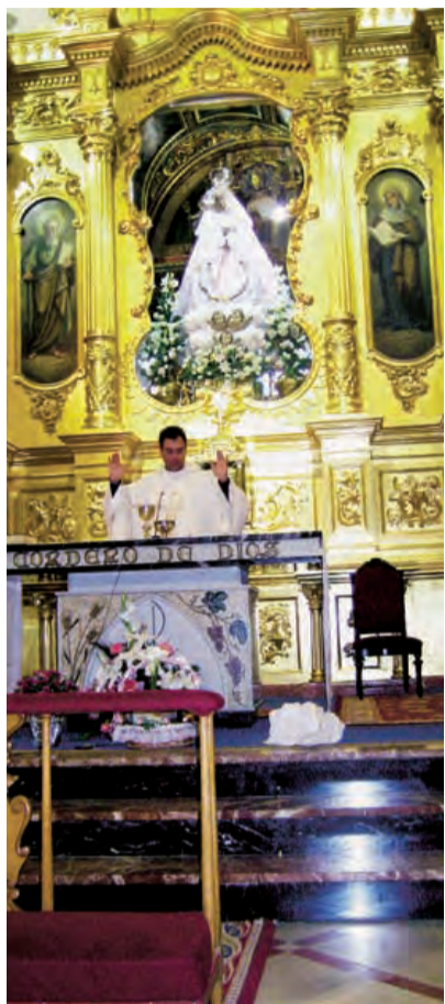
► Durante la Eucaristía.

Desde hace 32 años al comenzar el mes de mayo, el Neocatecumenado Parroquial viene peregrinando al santuario de Nuestra Señora de las Virtudes de Villena, a dar gracias a la Madre y pedirle auxilio para seguir a Cristo con fidelidad.