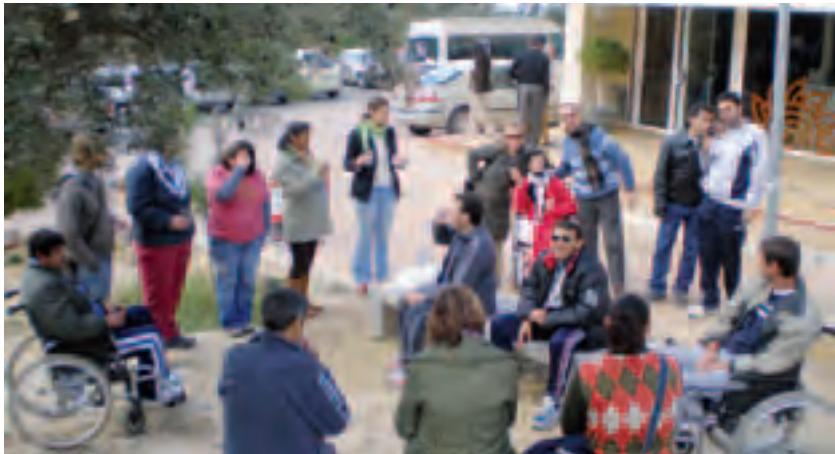
► Afectados por el VIH/SIDA y voluntarios.

La Casa de Acogida Véritas, de Cáritas Diocesana, organiza un campo de trabajo este verano para voluntarios que quieran participar con personas enfermas de sida. «Llegaremos a Tiempo», es el lema para esta tercera edición. Esta invitación va dirigida a todas las personas que quieran comprometerse como voluntarias de forma más intensa durante el verano. El año pasado, 10 voluntarios secundaron esta propuesta junto con los trabajadores de Véritas.