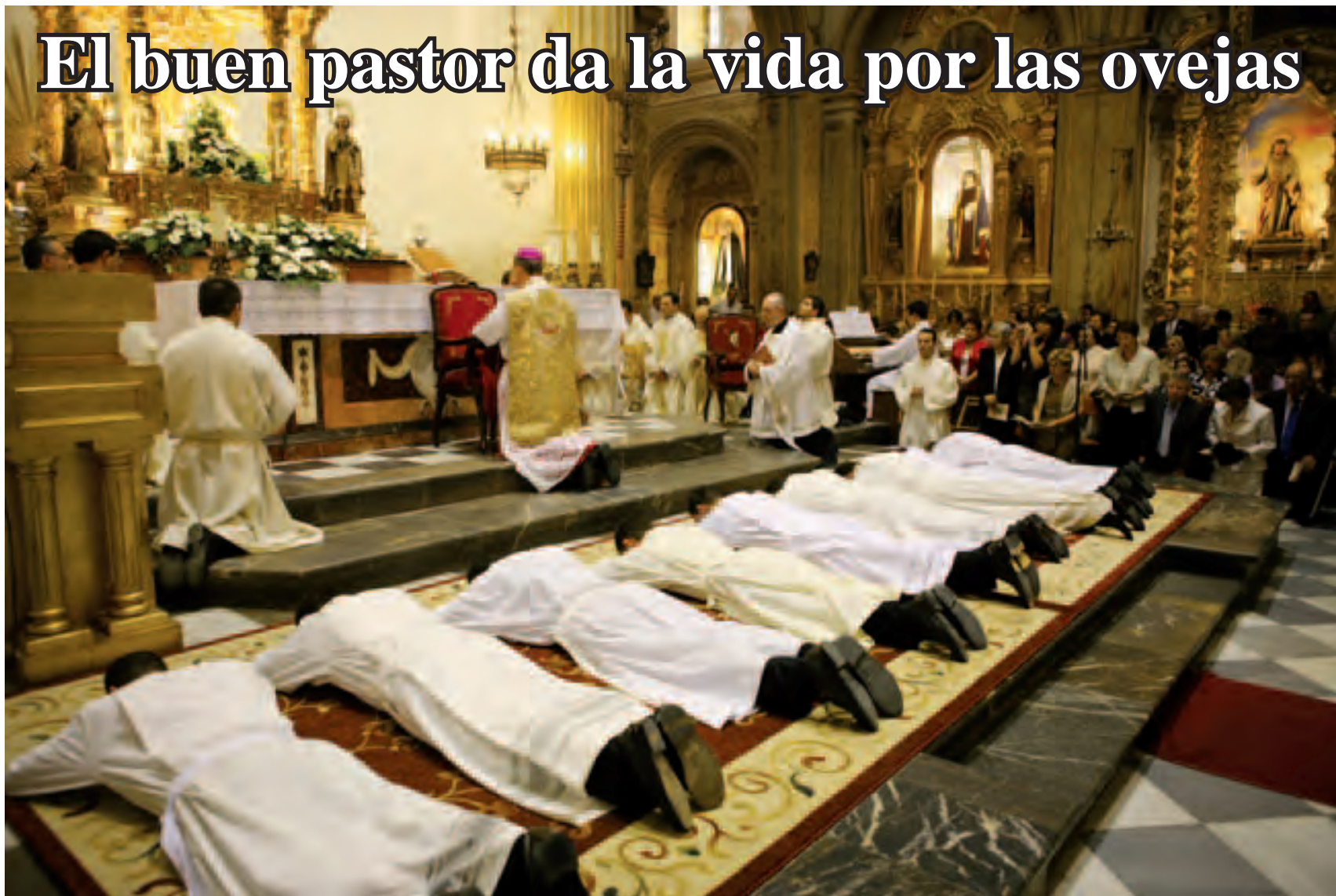
► Ordenación en San Martín Obispo, Callosa de Segura.