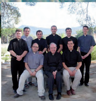
DOSSIER PÁG. 11 Ocho nuevos presbíteros al servicio del pueblo de Dios