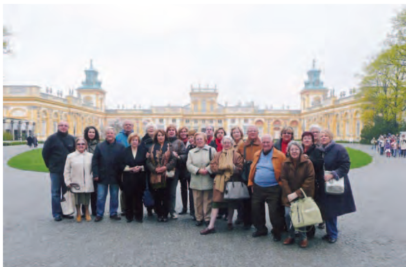
►...se nota una fe joven y profunda que llega a todos los lugares y a todas las edades.

Estuvimos en Cracovia, antigua capital de Polonia. Fue residencia de reyes y centro de cultura. Allí se encuentra: la colina de Wawel con la Catedral, la Iglesia de Santa María, del siglo XIII, con el maravilloso retablo gótico que es el más grande de Europa, la Plaza del Mercado y el famoso Mercado de Paños, el barrio judío Kazmierz, único en su género.