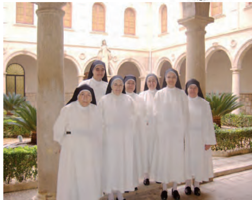
► La comunidad de Dominicanas en el claustro del convento de Orihuela.

—Como le hemos dicho, vivimos la gracia de la contemplación. Nuestra vida se desarrolla en torno a la celebración de la eucaristía y la liturgia de las horas. Nuestra oración litúrgica y personal está abierta a quines deseen un espacio de oración; para ello disponemos de una pequeña hospedería.