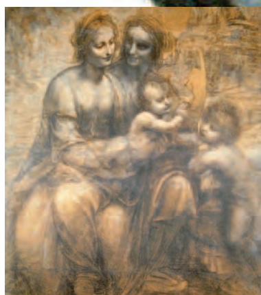
CARTA DEL OBISPO PÁG. 5 María es el sí de Dios a la Vida