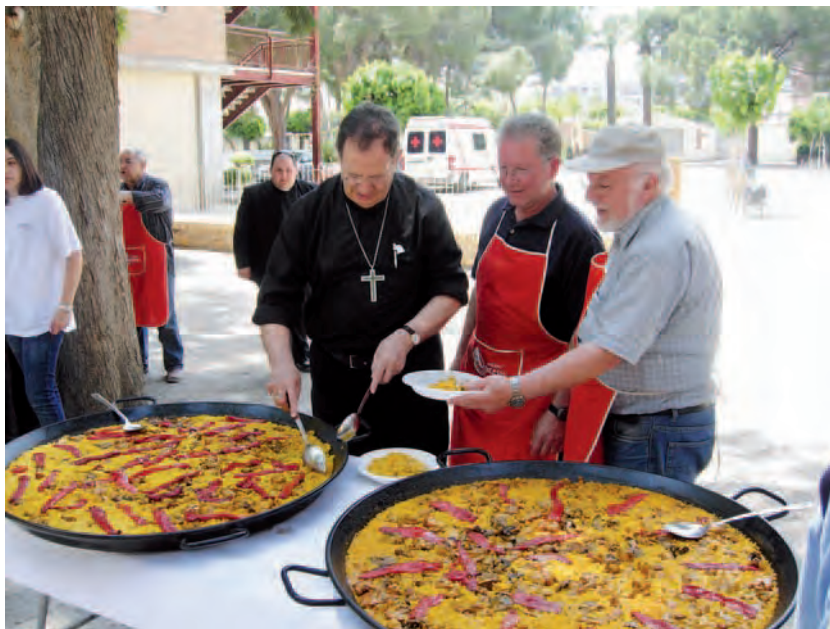
► Las paellas están listas... a servir el arroz.