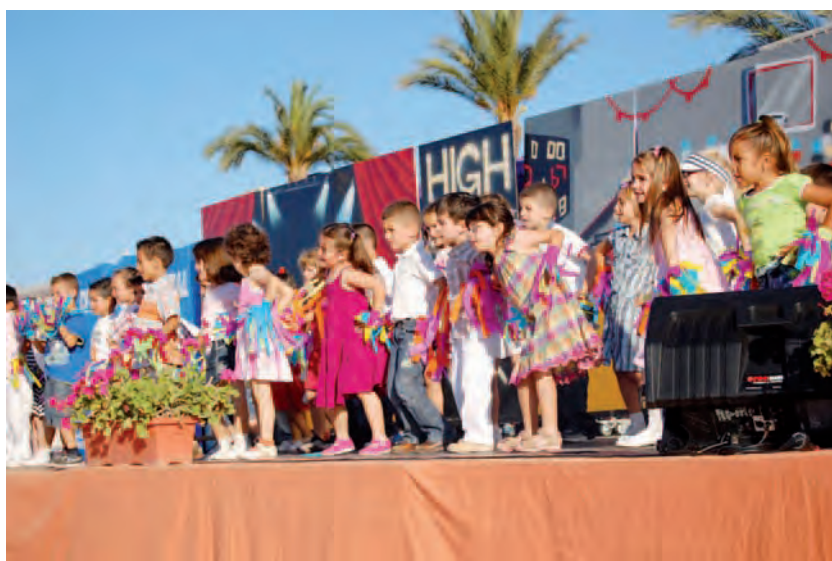
► Los más pequeños aportan toda su alegría.s

Pero en el centro de todas las actividades del colegio, la propuesta «estrella» del calendario anual es la «Cena Intercultural», que en el pasado mes de mayo cumplió su 5.ª edición. Para su realización contamos con cola-