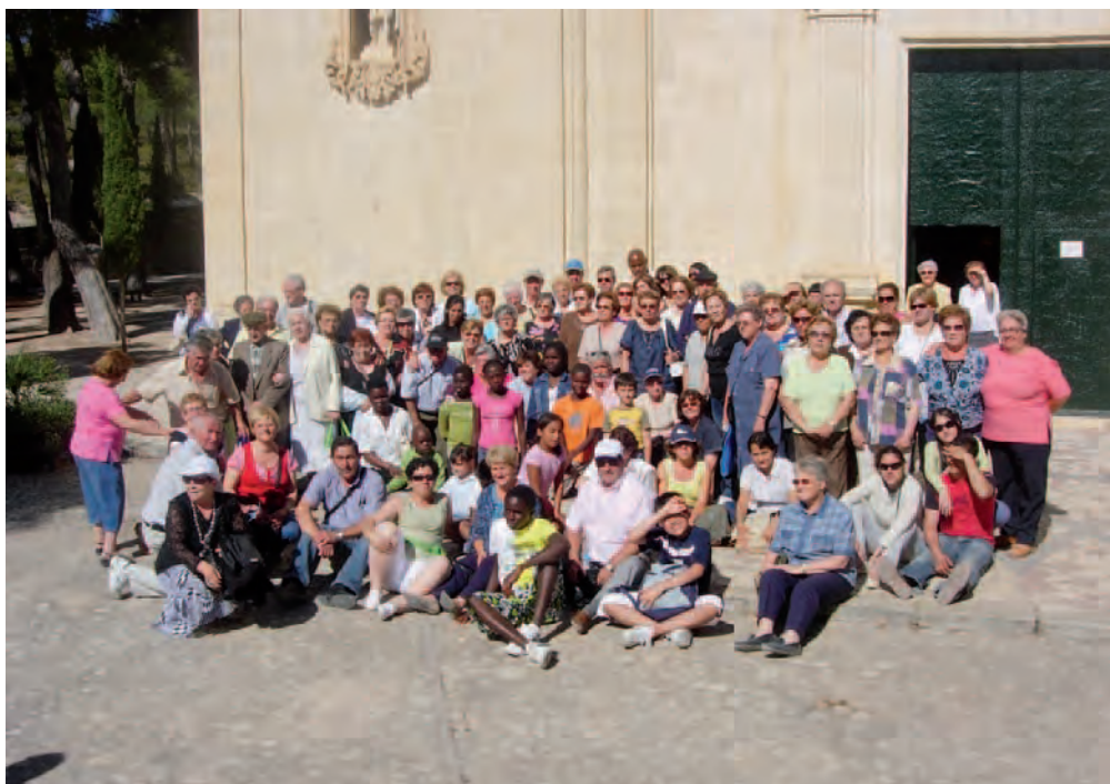
► Ante el Santuario de Nuestra Señora de Gracia.