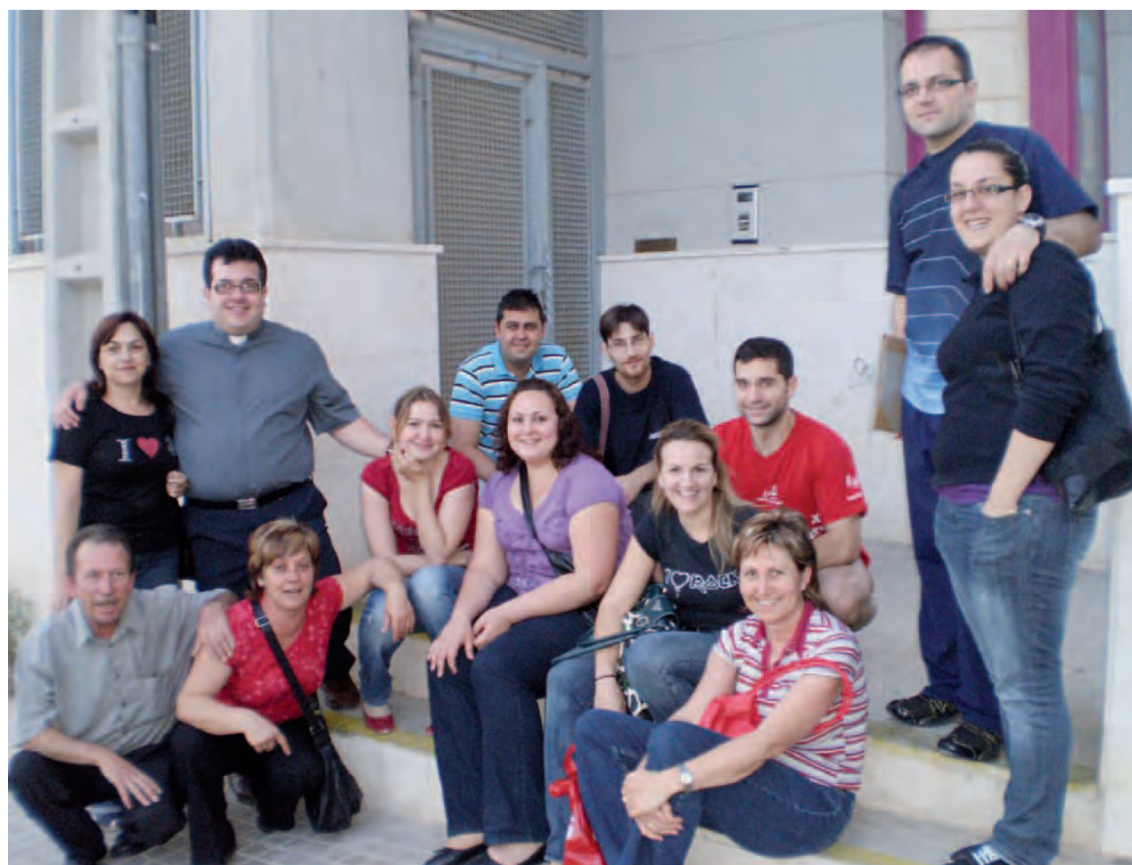
► «La Iglesia existe para evangelizar», y somos todos nosotros responsables de que esta actividad eclesial se lleve a cabo.

Esperamos que este catecumenado sea acogido como buena noticia y signo de esperanza por todos los cristianos de esta Iglesia que camina en Orihuela-Alicante.