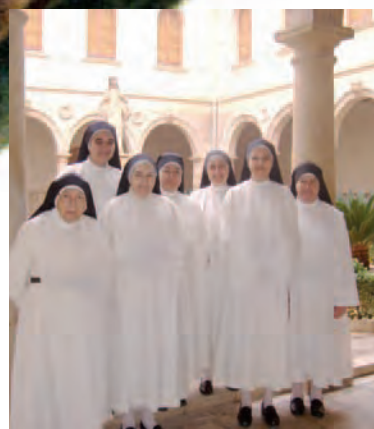
VIDA CONTEMPLATIVA PÁG. 14 Monjas Dominicas: más de 400 años de presencia en Orihuela