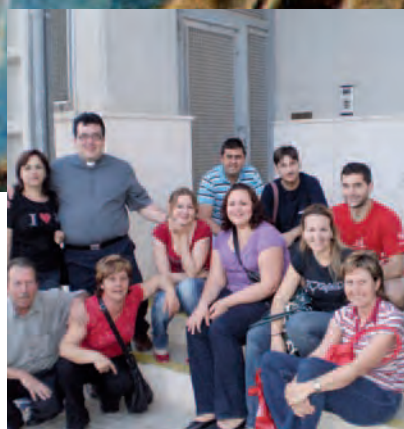
ENTREVISTAS PÁG. 13 Catecumenado de Adultos: Buena noticia y signo de esperanza