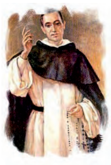
Francisco Coll y Guitart