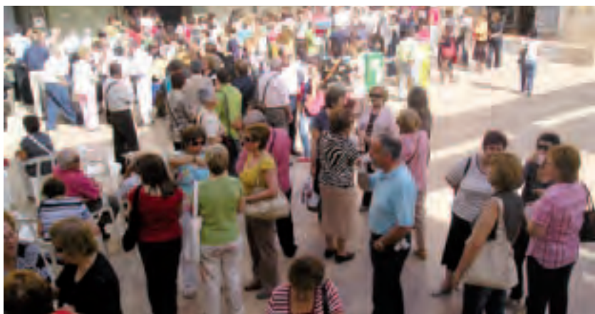
► Participantes en el VI Encuentro en un momento de descanso.