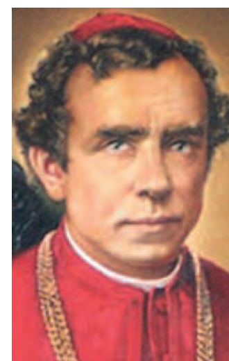
Segismundo Felix Felinski