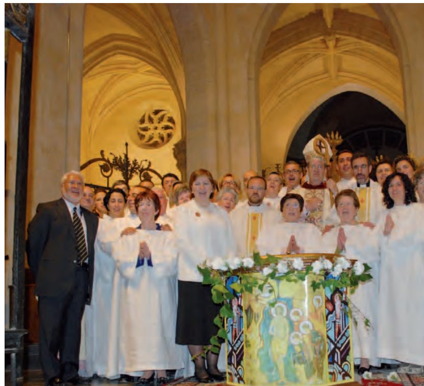
►Un grupo de hermanos con el Obispo Diocesano, en Santiago Apóstol de Albaterra.

Por todo esto, queremos agradecer al Señor por los párrocos que nos han asistido durante todos estos