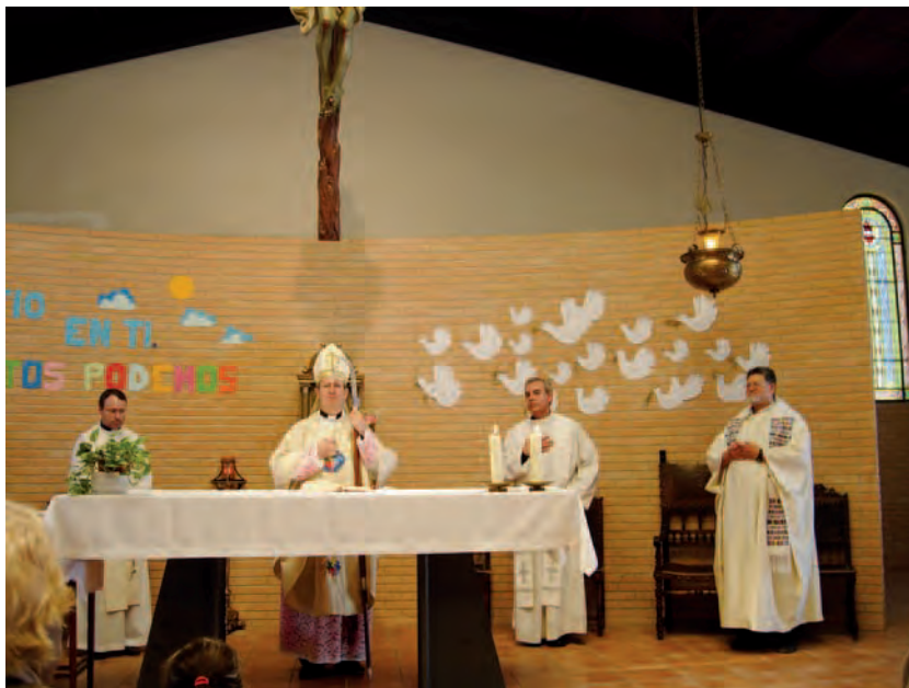
► Celebración de la Eucaristía en la capilla del colegio Jesús María, en Orihuela.

Los Profesionales Sanitarios Cristianos, PROSAC, se encargaron de la suscripción y reparto de material en bolsas y carpetas. Y la Asociación Gastronómica crevillentina «Arros y mondongo» preparó unas succulentas paellas para todos, no sobró nada y lo mejor es que fue financiado por la Hospitalidad Ntra. Sra. de Lourdes de la Diócesis. Tampoco