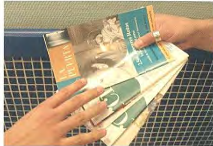
Te agradezco que me envíes La Puerta

Por otro lado, la Pascua está ahí cerca y su mensaje, es como siempre, Jesús de Nazaret, que: "habiéndolo amado a los suyos, que estaban en el mundo, los amó hasta el extremo"... según se lee en Jn. 13, 1-15. Y pienso: ¿quiénes somos los "suyos" que antes estaban y ahora también estamos... sino nosotros/as que, privilegiados por la Fe, que nos hace creer en Él, y la Esperanza de liberación y Perdón nos ha ganado?