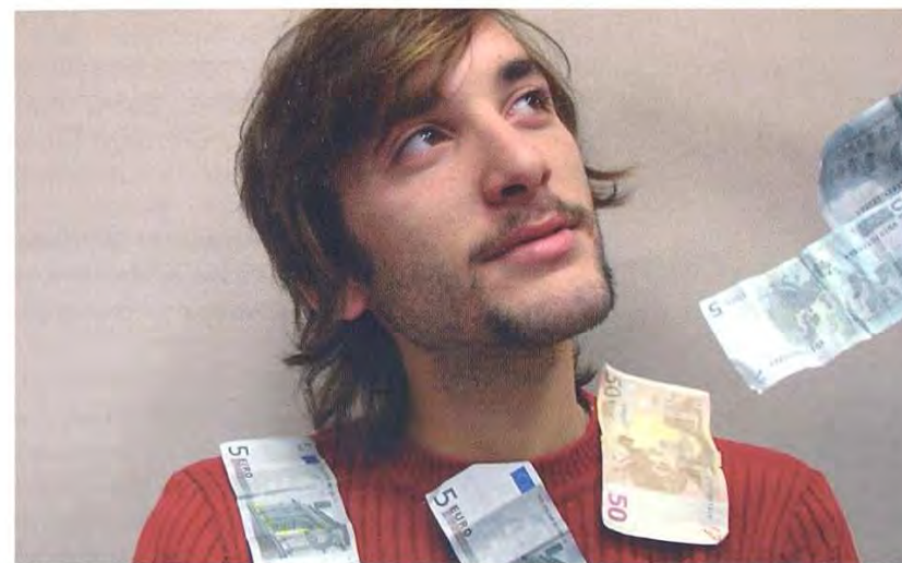
'No debemos estar de brazos cruzados esperando que nos llueva del cielo lo que creemos necesitar'

Dejamos que nos hagan creer que necesitamos un montón de cosas para ser felices, para formar parte de la