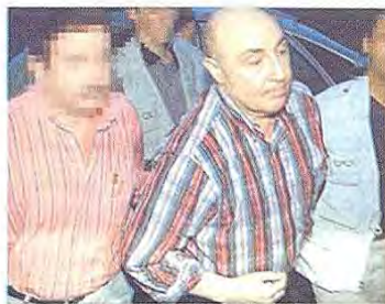
La semilibertad concedida a Luis Roldán cuando ha cumplido ocho años de los fue condenado ha desatado una ola de críticas a los beneficios penitenciarios de “cuadro blanco”. El ex director de la Guardia Civil, protagonista del mayor caso de corrupción de la etapa socialista, salvo su botín en toda clase de travesas. Ahora, luego de su salida, intenta recuperar el patrimonio millonario que le embolsó la justicia.

El patio se calienta todavía más cuando se escuchan los argumentos “peregrinos”, por no decir casi insultantes, que motivan la concesión del tercer grado, basándose en que ha desaparecido la “alarma social”. Y digo yo que habrá desaparecido en Bali, en Australia o en las Islas Caimán, pero lo que es en España difícil, pues después de más de ocho años de producidos los hechos, todo el mundo recuerda el